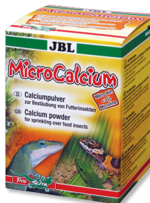
JBL MicroCalcium Mangime complementare con minerali per tutti i rettili