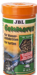
JBL Gammarus Leckerbissen für Wasserschildkröten von 10-50 cm