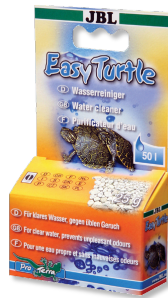
JBL EasyTurtle Spezialgranulat zur Beseitigung von Gerüchen