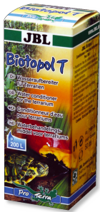
JBL Biotopol T Wasseraufbereiter für Terrarien