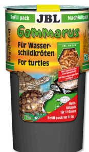
JBL Gammarus Nachfüllpack Leckerbissen für Wasserschildkröten von 10-50 cm