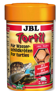
JBL Tortil Futtertabletten für Wasser- und Sumpfschildkröten