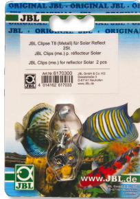
JBL Clips T5/T8 (Métal) Fixation en métal pour tubes fluorescents