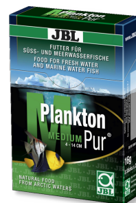
JBL PlanktonPur MEDIUM Leckerbissen für große Aquarienfische