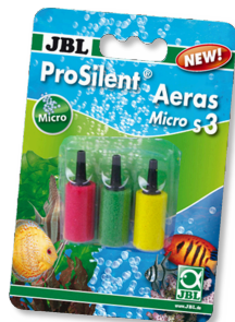
JBL ProSilent Aeras Micro S3 Kit de diffuseurs pour bulles d'air fines en aquarium