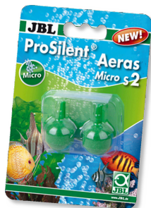
JBL ProSilent Aeras Micro S2 Diffuseurs d'air pour bulles fines dans l'aquarium