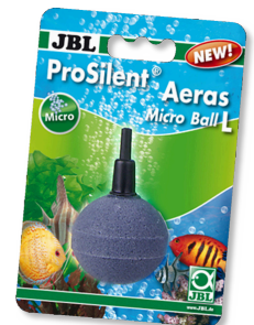
JBL ProSilent Aeras Micro Ball L Diffuseur d'air pour bulles fines