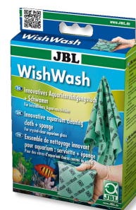
JBL WishWash Lavette et éponge