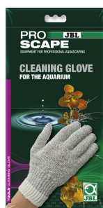
JBL PROSCAPE CLEANING GLOVE Gant de nettoyage pour aquarium