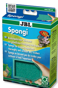
JBL Spongi Éponge de nettoyage pour aquarium et terrarium