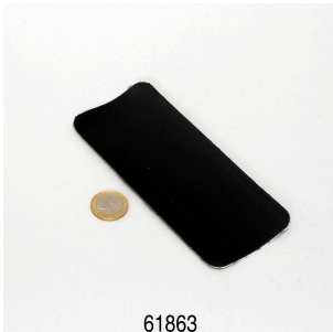
JBL Floaty Pad