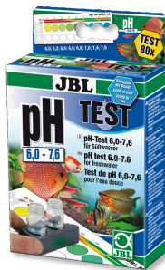
JBL Test pH 6,0-7,6 Test pH per acquari d'acqua dolce, ambito di 6,0-7,6