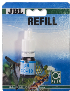
JBL pH 3,0-10,0 Test Schnelltest zur Bestimmung des Säuregehalts