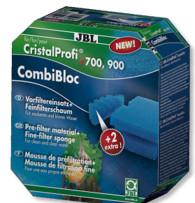
JBL CombiBloc CristalProfi e Vorfiltereinsätze und Schaum für CristalProfi e