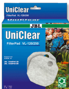
JBL FilterPad VL Wattevlies für Aquarienfilter CristalProfi