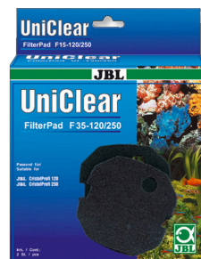
JBL FilterPad F35 Feiner Schaumstoff für Aquarienfilter CristalProfi