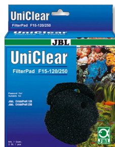
JBL FilterPad F15 Grober Schaumstoff für Aquarienfilter CristalProfi