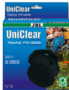
JBL FilterPad F15 Grober Schaumstoff für Aquarienfilter CristalProfi