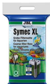
JBL Symec XL Ouate filtrante grossière contre la turbidité de l'eau