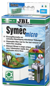
JBL Symec micro Mikrovlies für Aquarienfilter gegen Wassertrübungen