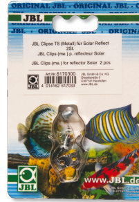
JBL Clipse T5/T8 Metall Metallhalterung für Leuchtstoffröhren