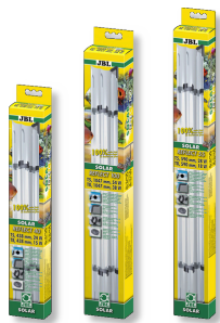
JBL SOLAR Reflect T5/T8 - 895-1500 mm Pannello riflettore per tubo fluorescente Solar