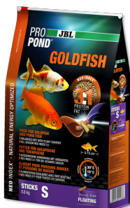
JBL PROPOND GOLDFISH S Futtersticks für kleine Goldfische