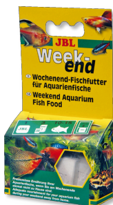
JBL Weekend Wochenend-Alleinfutter für alle Aquarienfische