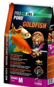
JBL PROPOND GOLDFISH M Futtersticks für mittlere bis große Goldfische