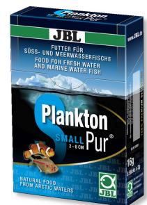
JBL PlanktonPur SMALL Leckerbissen für kleine Aquarienfische