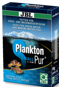
JBL PlanktonPur SMALL Leckerbissen für kleine Aquarienfische