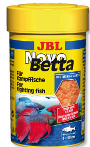
JBL NovoBetta Mangime completo per pesci labirinto come i pesci combattenti