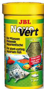
JBL NovoVert Mangime di base: fiocchi per pesci d'acquario erbivori