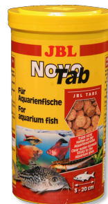
JBL NovoTab Mangime base in compresse per tutti i pesci d'acquario