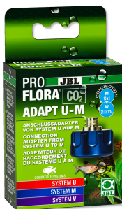
JBL PROFLORA CO2 ADAPT U - M Adaptateur bouteille jetable / bouteille rechargeable