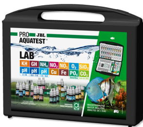
JBL PROAQUATEST LAB Coffret de 13 tests pour analyse de l'eau douce