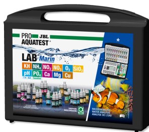
JBL PROAQUATEST LAB Marin Coffret professionnel d'analyse de l'eau de mer