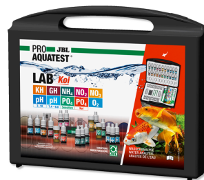
JBL PROAQUATEST LAB Koi Coffret de tests professionnel pour bassins