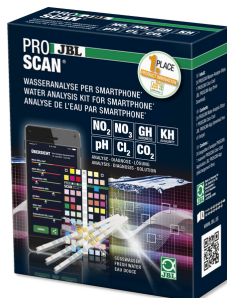
JBL PROSCAN Test de l'eau avec analyse sur smartphone