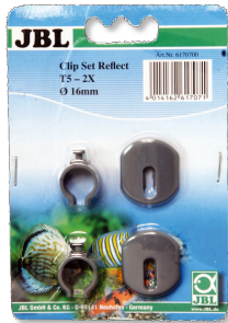
JBL SOLAR REFLECT Kit clips Fixation pour tubes fluorescents