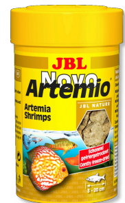
JBL NovoArtemio Complément d'artémias pour tous poissons d'aquarium