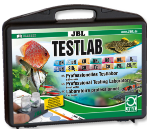
JBL Testlab Coffret de 13 tests pour analyse de l'eau douce