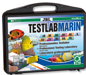
JBL Testlab Marin Coffret professionnel d'analyse de l'eau de mer