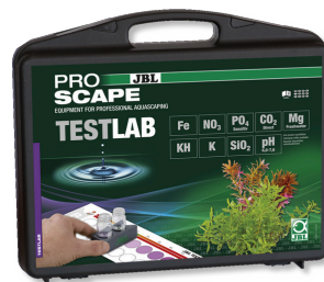
JBL Testlab ProScope Coffret d'analyse de l'eau en aquarium planté