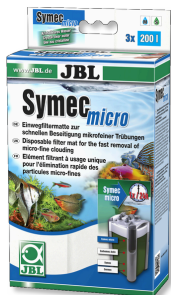
JBL Symec micro Microfibre pour filtre d'aquarium contre l'eau turbide