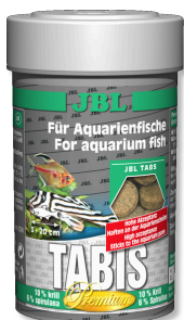
JBL Tabis Comprimés pour poissons d'eau douce et d'eau de mer