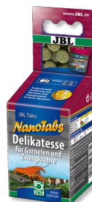
JBL NanoTabs Aliment de base pour crevettes et écrevisses naines