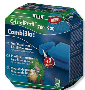
JBL CombiBloc CristalProfi e Blocs de préfiltration et mousse pour CristalProfi e