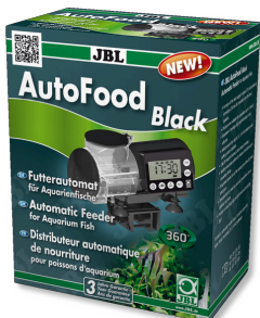
JBL AutoFood NOIR Distributeur de nourriture noir pour aquarium