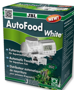
JBL AutoFood BLANC Distributeur de nourriture blanc pour aquarium