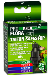
JBL PROFLORA CO2 TAIFUN SAFESTOP Защита от обратного тока воды для установок CO2