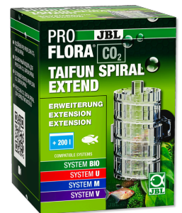
JBL PROFLORA CO2 TAIFUN SPIRAL EXTEND Расширение для JBL PROFLORA CO2 TAIFUN SPIRAL 5 / 10