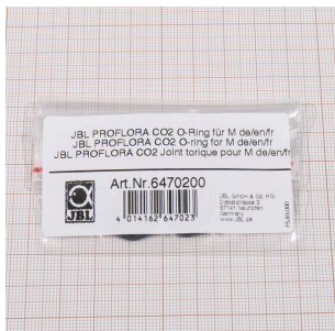
JBL PROFLORA CO2 уплотн. кольцо для М