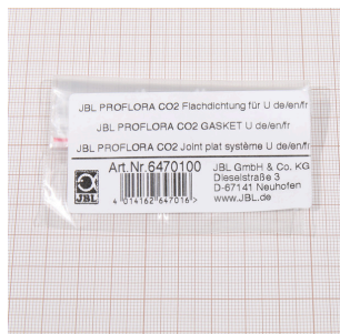
JBL PF CO2 плоское уплотнение для U