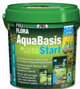
JBL PROFLORA AquaBasis Start

Питательный грунт для пресноводных аквариумов