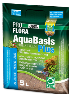
JBL PROFLORA AquaBasis plus

Удобрение для растений в пресноводных аквариумах