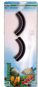
JBL AntiKink Защита от перегиба шланга