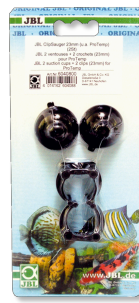
JBL suction cup with clip 23 мм Резиновые присоски для предметов диаметром 23-28 мм