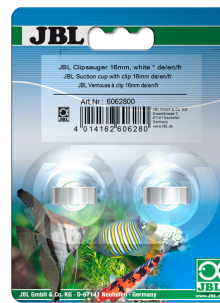
JBL suction cup with clip, 16 мм Резиновые присоски для объектов диаметром 16 мм