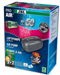
JBL PROAIR a50 Компрессор для аквариума