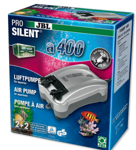
JBL PROSILENT a400 Компрессор для пресноводных и морских аквариумов