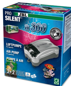
JBL PROSILENT a300 Компрессор для пресноводных и морских аквариумов