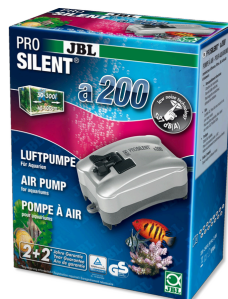
JBL PROSILENT a200 Компрессор для пресноводных и морских аквариумов