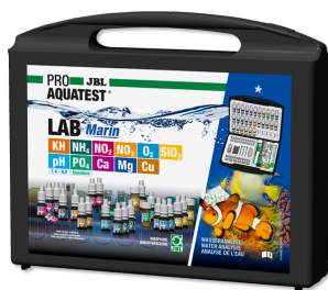
JBL PROAQUATEST LAB Marin Чемоданчик с профессиональными тестами морской воды