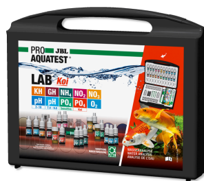
JBL PROAQUATEST LAB Koi Чемоданчик с профессиональными тестами для пруда с кои