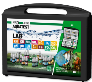
JBL PROAQUATEST LAB Чемоданчик с 13 тестами параметров пресной воды