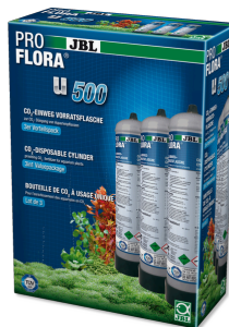
JBL PROFLORA 3 x u500 Сменный одноразовый CO2 баллон