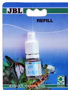
JBL pH 7,4-9,0 тест Тест pH в диапазоне 7,4-9,0 для аквариумов и прудов