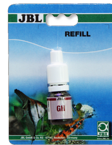
JBL GH Тест Экспресс-тест для определения общей жёсткости