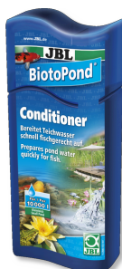
JBL BiotoPond Кондиционер для пруда