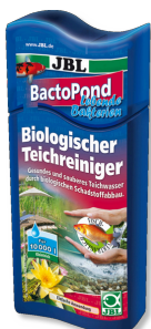
JBL BactoPond Бактерии для самоочистки пруда