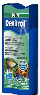
JBL Denitrol Стартовые бактерии для подселения аквариумных рыб