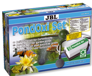
JBL комплект PondOxi Комплект с компрессором для аэрации в садовом пруду