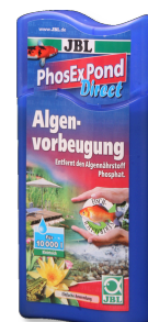
JBL PhosEx Pond Direct Средство для устранения фосфатов из прудовой воды