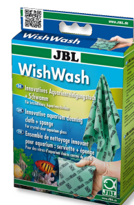
JBL WishWash Чистящая салфетка и губка