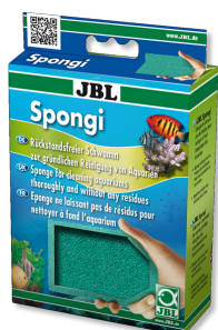
JBL Spongi Чистящая губка для аквариумов и террариумов