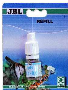
JBL pH 7,4-9,0 тест Тест pH в диапазоне 7,4-9,0 для аквариумов и прудов