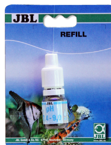
JBL pH 7,4-9,0 тест Тест pH в диапазоне 7,4-9,0 для аквариумов и прудов