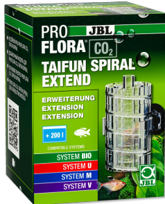
JBL PROFLORA CO2 TAIFUN SPIRAL EXTEND Ampliação para JBL PROFLORA CO2 TAIFUN SPIRAL 5 / 10