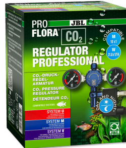
JBL PROFLORA CO2 REGULATOR PROFESSIONAL Regulador pressão c/ 2 indicações e válv. magn. p/ CO2