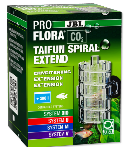
JBL PROFLORA CO2 TAIFUN SPIRAL EXTEND Ampliação para JBL PROFLORA CO2 TAIFUN SPIRAL 5 / 10