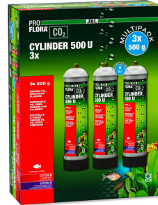
JBL PROFLORA CO2 CYLINDER 500 U 3x Garrafa reserva CO2 descart. 500g (pack promoção 3 un.)