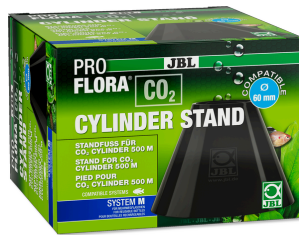
JBL PROFLORA CO2 CYLINDER STAND Base de apoio para garrafas de CO2 com 500 g