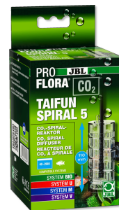
JBL PROFLORA CO2 TAIFUN SPIRAL 5 Reator de CO2 ampliável p/ aquários água doce de 200 l