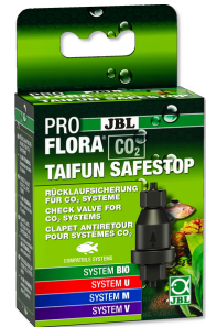
JBL PROFLORA CO2 TAIFUN SAFESTOP Válvula de retenção da água para sistemas de CO2