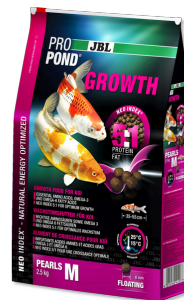
JBL PROPOND GROWTH M

Alimento para o crescimento para carpas Koi pequenas