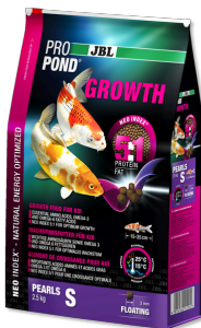
JBL PROPOND GROWTH S

Alimento para o crescimento para Kois muito pequenos