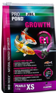
JBL PROPOND GROWTH XS

Alimento para o crescimento para Kois muito pequenos