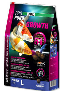
JBL PROPOND GROWTH L

Alimento que favorece o crescimento para Kois médios