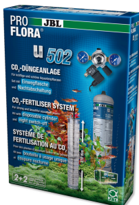
JBL PROFLORA u502 Sist. fertilização de plantas com desligamento noturno