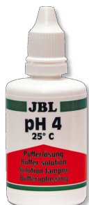
JBL Solução tampão pH 4,0 Líquido de calibragem com pH 4,0 para elétrodos de pH