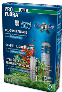
JBL PROFLORA u501 Kit completo para o sistema de fertilização de plantas