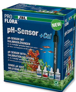
JBL PROFLORA Sensor de pH+Cal Elétrodo de pH com conexão BNC