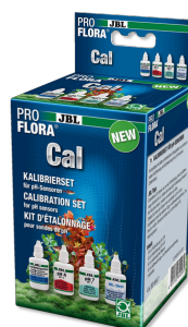
JBL PROFLORA Cal Conjunto completo para a calibração