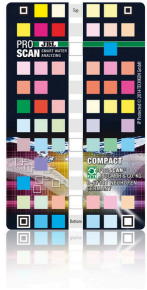
JBL PROSCAN ColorCard