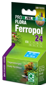
JBL PROFLORA Ferropol 24

Fertilizante de plantas para aquários de água doce