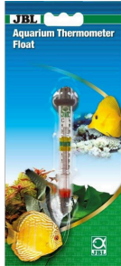
JBL Termómetro de aquário Float Termómetro para aquários